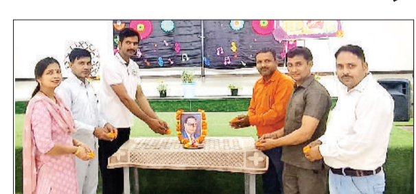
चरखी दादरी। डॉ. भीमराव अंबेडकर की प्रतिमा पर पुष्प अर्पित करते स्टाफ सदस्य