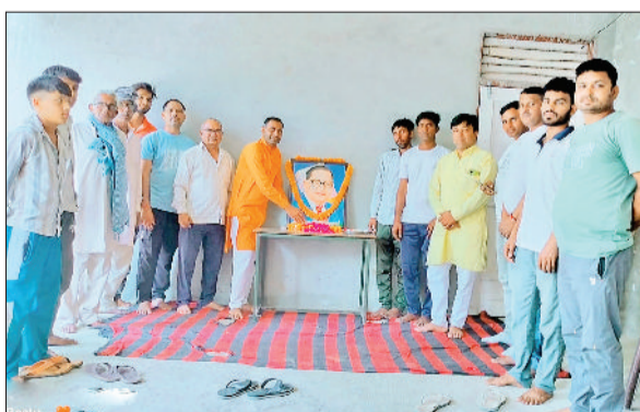
तोशाम। अम्बेडकर के चित्र पर पुष्प अर्पित करते हुए।