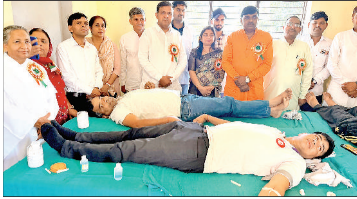
मिवानी | रक्तदाताओं को बैज लगाते अतिथि।