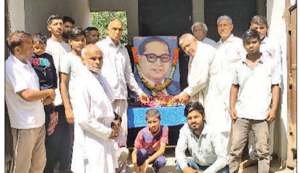
चरखी दादरी। बाबा साहेब को नमन करते क्षेत्रवासी।