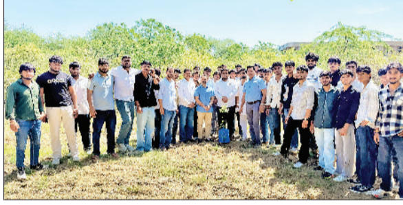
मिवानी। बाबा साहेब की जयंती पर पौधरोपण करते विद्यार्थी।