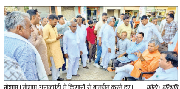
तोशाम। तोशाम अनाजमंडी में किसानों से बातचीत करते हुए।

भिवानी-महेन्द्रगढ़ सांसद धर्मबीर सिंह सोमवार शाम को तोशाम अनाज मंडी पहुंचे। जहां उन्होंने खरीद प्रक्रिया और व्यवस्थाओं का जायजा लिया। सांसद ने अनाज मंडी में अधिकारियों के साथ बैठक कर खरीद सुचारू करने के निर्देश दिए। वहीं इस दौरान आदृतियों ने अपनी समस्याएं भी रखी। बता दें कि तोशाम अनाज मंडी में गेहू व