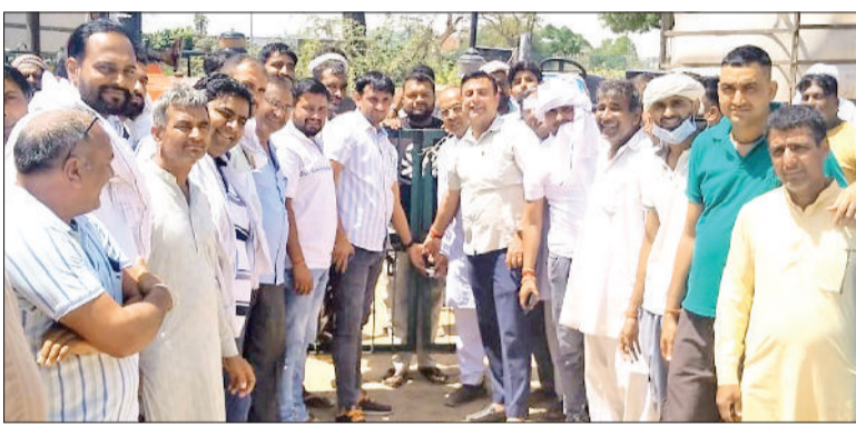
बवानीखेड़ा। अनाजमंडी के गेट पर ताला लगाते आढ़ती और मंडी का गेट बंद करने के बाद बाहर सड़क पर लगी ट्रैक्टरों की लाइन।