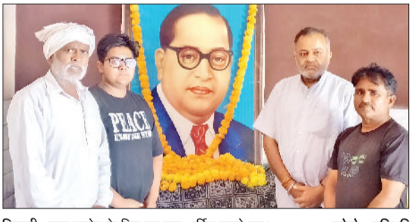
मिवानी। बाबा साहेब के चित्र पर पुष्प अर्पित करते हुए।